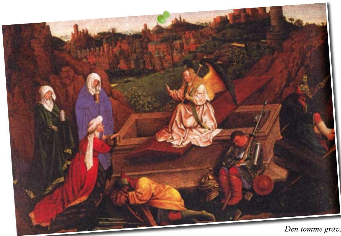
Den tomme grav.

lige salme "Stol du kun på dit fadervor". Et meget spændende, varieret og iørefaldende værk. Der vil også være en afdeling med danske sange af bl.a. C.E.F. Weyse, Carl Nielsen og Niels la Cour.