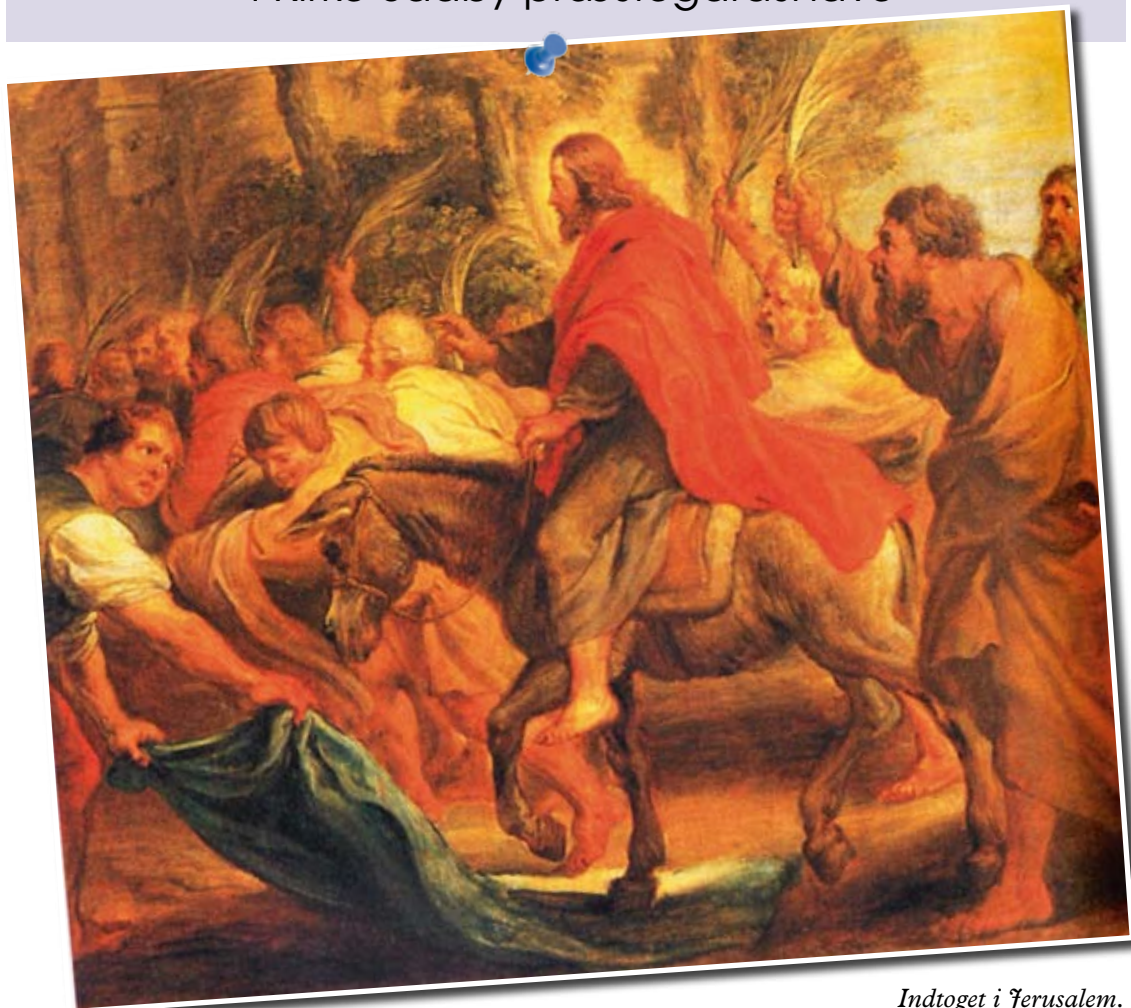
Indtoget i Jerusalem.

Tid til at melde sig til kræmmermarkedet i Kirke Saaby præstegårdshave