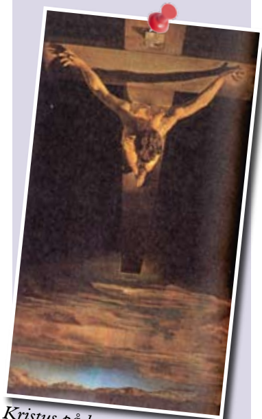
Kristus på korset.