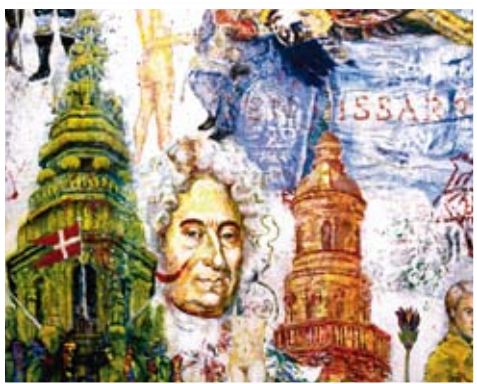
Uddrag fra maleri af Rylander

Kirkespisning den 14. marts kl. 18.30 i Kirke Saaby kirke og Den gamle Skole.